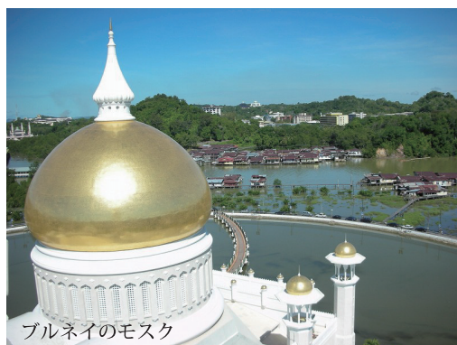
ブルネイのモスク